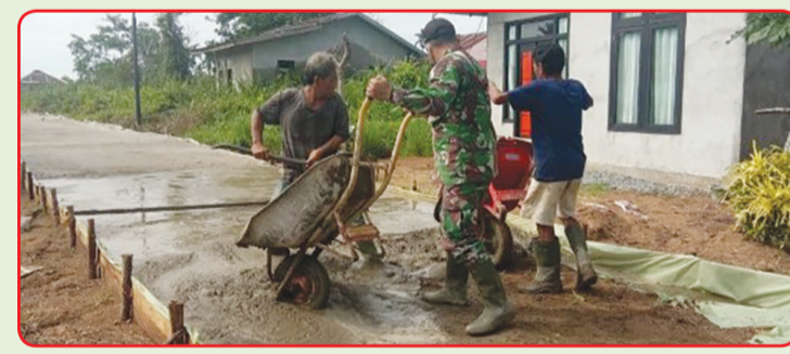
Kegiatan karya bhakti Kodim 1207/BS

PONTIANAK (IM) - Hasil pembinaan teritorial di lingkungan Kodim 1207/BS, khususnya di wilayah Koramil 120701/Pontianak Utara, dengan adanya penyaluran bantuan kepada masyarakat yang ada di Pontianak Utara, dilaksanakan Minggu (6/6).