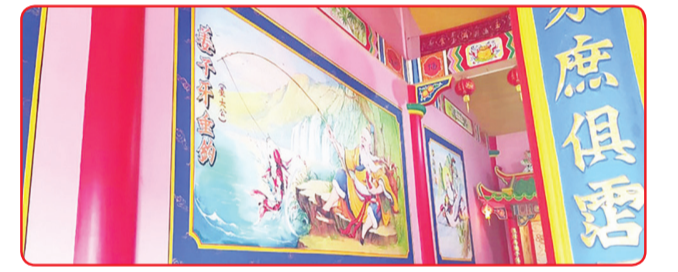
Lukisan Jiang Tai Gong sedang memancing ikan di Kelenteng Yu Hua.

Sekaligus memberikan petunjuk terkait pembangunan klenteng tersebut. • idn/din