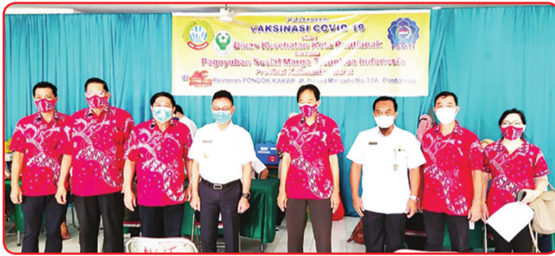
FOTO BERSAMA: Wali Kota dan Kepala Dinas Kesehatan Pontianak foto bersama Ketua dan Pengurus PSMTI Kalbar.

Lansia kami ajak terus, bekerjasama dengan berbagai lembaga seperti PSMTI, Yayasan Bhakti Suci dan lembaga lainnya.