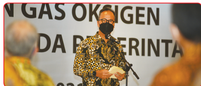
Menperin Agus Gumiwang Kartasasmita mewakili para industriawan memberikan laporan mengenai bantuan 2.000 tabung oksigen bagi Pemerintah India.

JAKARTA (IM) - Pengusaha Peduli NKRI serta Kementerian Perindustrian RI menyerahkan 2.000 buah tabung oksigen kepada Pemerintah India untuk membantu mengatasi ledakan kasus Covid-19 di India.