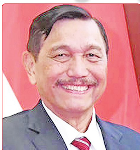
Menko Marves Luhut B Panjaitan.

“Pertemuan pertama mekanisme ini sangat penting, dan kedua belah pihak memiliki harapan yang tinggi.” Wang Wenbin menyatakan bahwa utusan khusus Presiden Indonesia sekaligus pemimpin kerja sama dengan Tiongkok, Luhut B. Panjaitan diutus oleh Presiden RI Joko Widodo untuk datang ke Tiongkok.