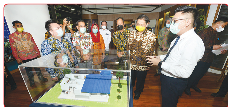
Para menteri dan tamu undangan meninjau Exhibition Hall di Tzu Chi Center untuk mengetahui jejak prestasi Yayasan Tzu Chi di Indonesia.

Bukan hanya bantuan ke luar negeri, di dalam negeri para pengusaha yang tergabung dalam Pengusaha Peduli NKRI