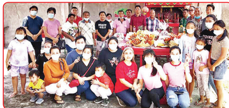
FOTO BERSAMA: Para warga Perkumpulan Marga Lu Sumatera Utara s berfoto bersama.

Hari kelahirannya tanggal tiga bulan delapan Imlek. Hingga saat ini, sayangnya belum ada Klenteng Jiang