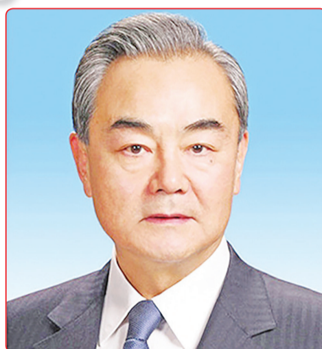
Anggota Dewan Negara sekaligus Menlu Tiongkok Wang Yi.

Hal ini telah merefleksikan pentingnya Indonesia dalam hubungan Tiongkok-Indonesia serta pertemuan ini.