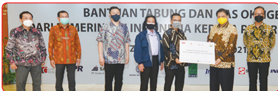
Para perwakilan Pengusaha Peduli NKRI secara simbolis memberikan donasi 2.000 tabung oksigen kepada Menko Perekonomian Airlangga Hartarto.